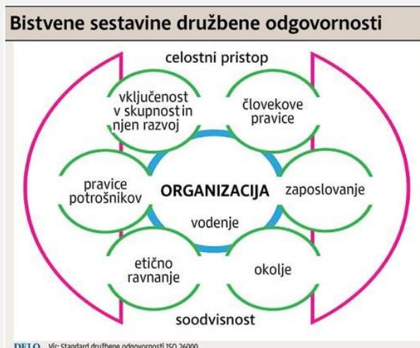
Slika 1: Slovenski prevod slikovnega prikaza 7 osrednjih vsebin in obeh povezovalnih kategorij družbene odgovornosti po ISO 26000 (ISO, 2010)

Četudi je neoliberalna doktrina ekonomije poslovnem prepovedala DO in četudi DO po ISO 26000 ni pravno predpisana, je v sodobnih razmerah vse bolj tržna nuja. Študije iz ZDA (Gerzema, 2010) in drugod (Google, spletna stran o DOP – CSR; Hoppe, 2012) so jasne: odjemalci vse bolj pazijo, ali kupujejo izdelke in storitve družbeno odgovornih ali drugih podjetij in drugih organizacij. Edino monopolisti se te izkušnje še ne držijo, a vsaj politični monopolisti so v zadnjih letih doživeli, da ima njihova zloraba njihove vplivnosti za njih same zelo težke posledice. Prej povzeta besedna igra, ki jo premore slovenščina (oblast itd.) in je veljala po rimskem pravu tisočletja kot pravica (privatnih) lastnikov in oblastnikov do uporabe in zlorabe imetja (in od njega odvisnih ljudi in narave), prehaja vse bolj v pravico do uporabe brez pravice do zlorabe ; to pravico so podjetniki in menedžerji že uvedli za svoje podrejene (s konceptom: lastnik procesa), zdaj pa še za sebe. Ljudje kot odjemalci in občani pač kaznujejo tiste, ki si jemljejo pravico do zlorabe.